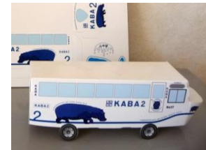
KABA オリジナルパーパークラフト