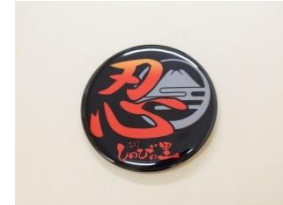
しのびの里オリジナルバッジ