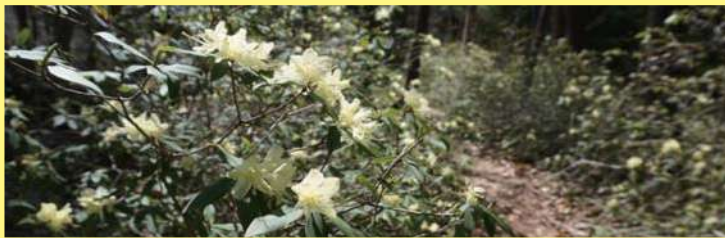
▲ヒカゲツツジの群生